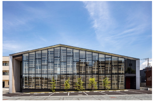
あさひ会計セミナー棟 古谷誠章+NASCA