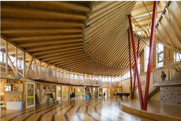
ちぐさこども園／仙田満+環境デザイン研究所